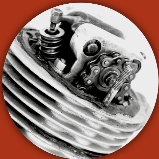
PARTICOLARE DELLA TESTATA STERZI DA 49CC REALIZZATA NEL 1953 E INSTALLATA SUL CICLOMOTORE STERZI

In questo contesto è doveroso ricordare la piccola realizzazione, datata 1953, della Sterzi di Brescia: un motore di soli 49 cc, munito di cambio a tre marce e dell'albero delle camme in testa mosso da una catena. Questo motorino non ebbe alcuna fortuna commerciale, ma sollevando il coperchio della testata si ha modo di apprezzare di primo acchito la bontà del progetto e la qualità della realizzazione che non ha proprio nulla da invidiare all'OHV degli amici giapponesi.