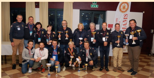
LA SQUADRA CORSE AMAMS TN

PORTA ALTO IL NOSTRO NOME IN ITALIA ED ALL'ESTERO